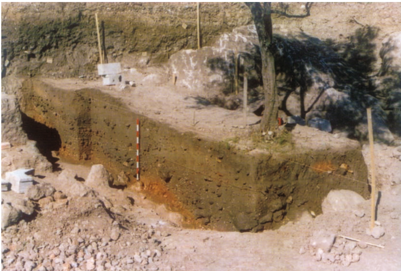
Figura 2. Corte estratigráfico

De acuerdo con ello y concretándonos en el sílex el número total del mismo es de 11887 (ver el cuadro que acompañamos), lo que pudiera parecer elevado aunque a nuestro criterio no lo es de acuerdo con el volumen de tierras tamizadas y, aún lo es menos si a esta cifra total le restamos las 11204 lascas y lasquitas desechos de talla, lo que da una cifra de 683 útiles, que rebajaríamos a 558 si descontamos los núcleos, sin hacerlo con las 278 hojas y hojitas porque las consideramos plenamente como útiles. En relación con el total del sílex los útiles representan únicamente el 4.98%, cifra evidentemente baja y que nos indica el escaso peso específico de los útiles líticos en las actividades cotidianas si exceptuamos algún tipo.